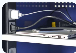
Ausführung: 2 Steckdosen pro Fach