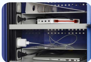
Optional ist auch ein zusätzlicher Fachboden lieferbar